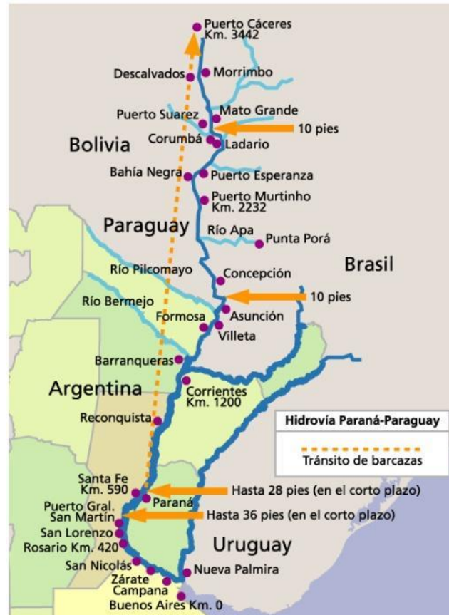
Figura 1: Mapa del tramo Red troncal del Río Paraná y sus principales puertos.

Red troncal del Río Paraná. La empresa comenzó a operar el 1 de mayo de 1995, para lo cual recibió un subsidio estatal de 40 millones de dólares anuales durante 8 años .