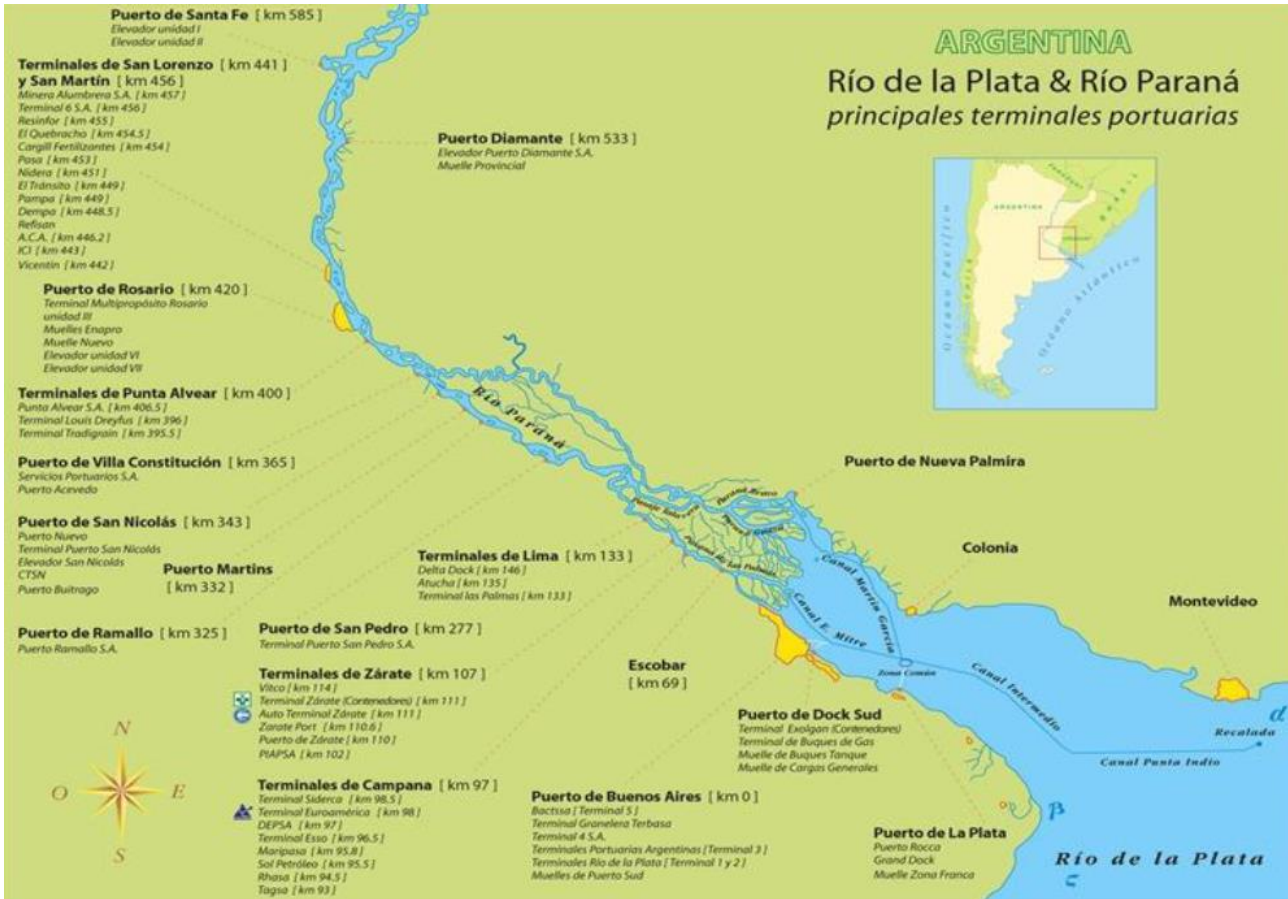
Figura 3: Principales terminales portuarias y canales de navegación